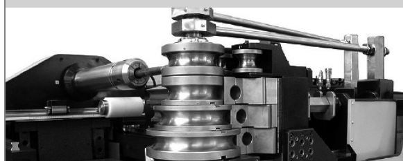
PROVAR 6 U-D