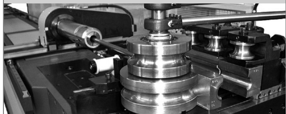
PROVAR 5 U-D