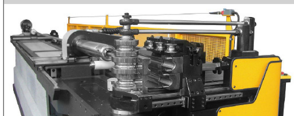
PROVAR 6 U-D