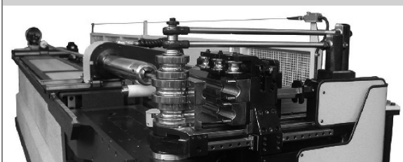
PROVAR 6 U-D