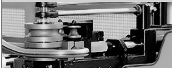
PROVAR 5 U-D